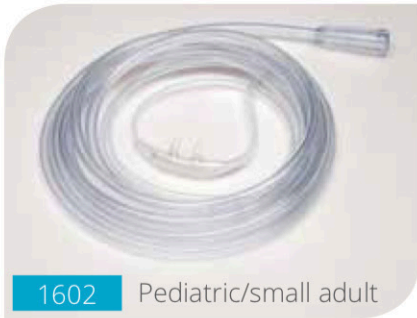
1602 Pediatric/small adult