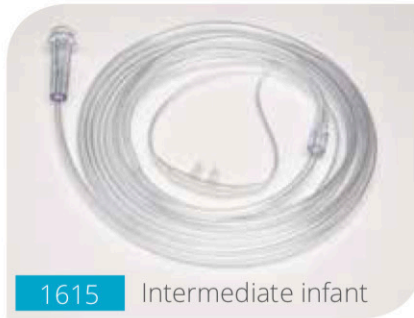
1615 Intermediate infant